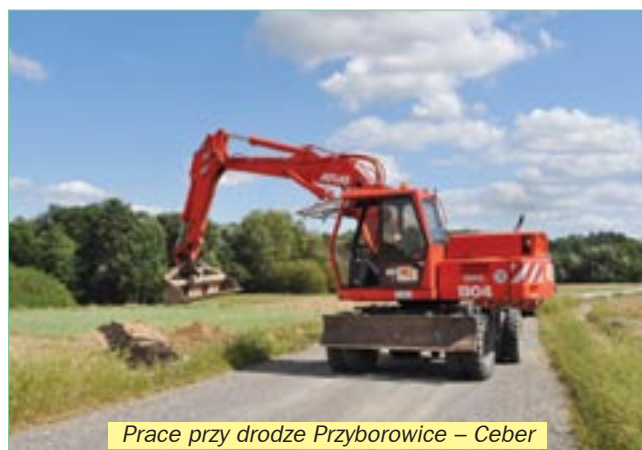
Prace przy drodze Przyborowice – Ceber