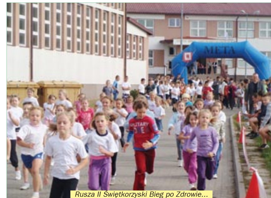
Rusza II Świętokrzyski Bieg po Zdrowie...