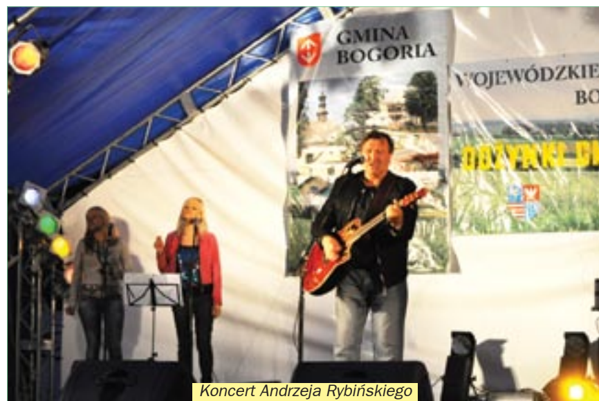
Koncert Andrzeja Rybińskiego