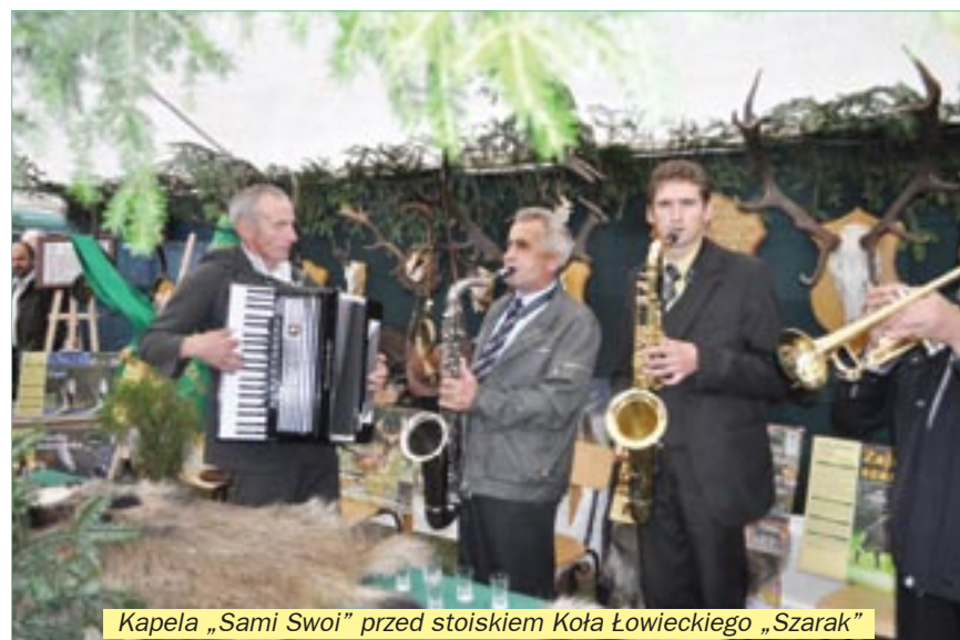
Kapela „Sami Swoi” przed stoiskiem Koła Łowieckiego „Szarak”