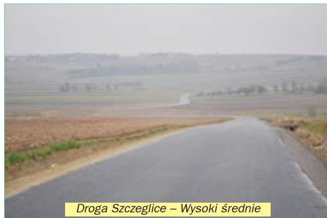
Droga Szczeglice – Wysoki Średnie