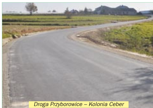
Droga Przyborowice – Kolonia Ceber