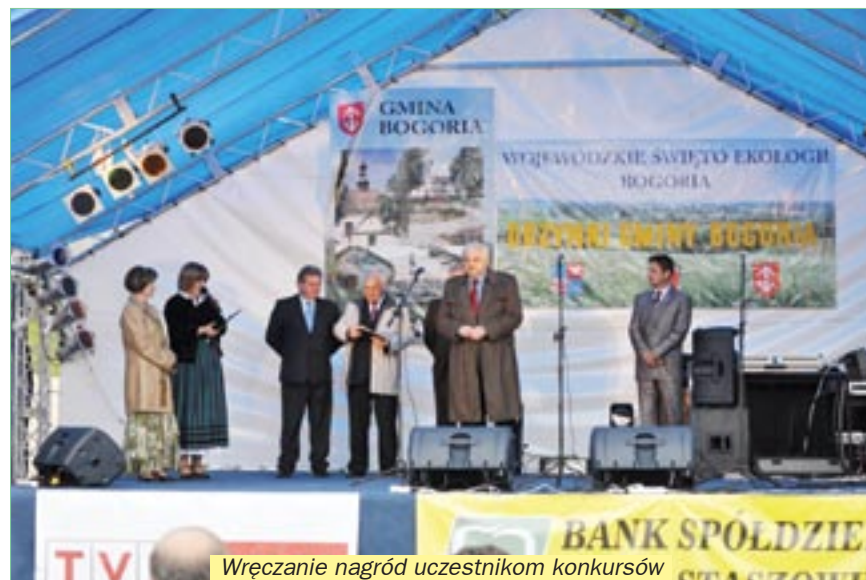
Wręczenie nagród uczestnikom konkursów