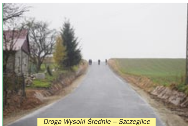
Droga Wysoki Średnie – Szczeglice