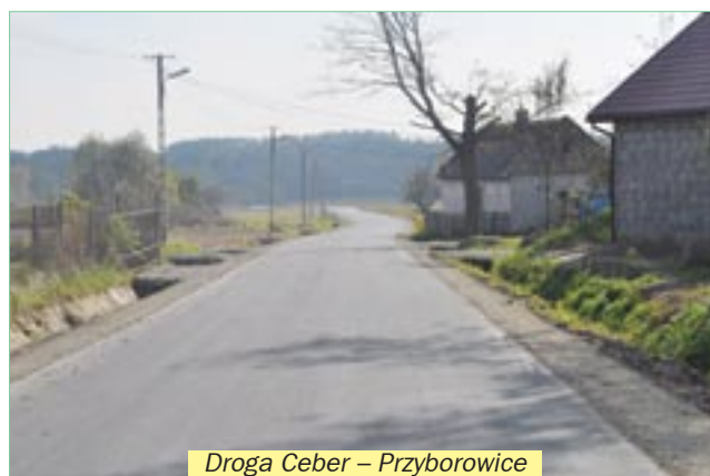
Droga Ceber – Przyborowice