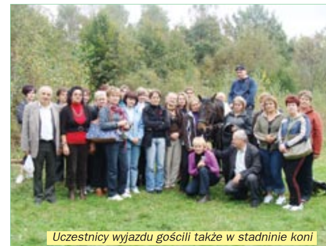
Uczestnicy wyjazdu gościli także w stadninie koni