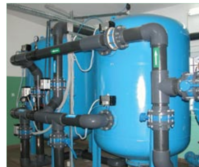
Zadanie było współfinansowane ze środków:

W chwili obecnej parametry jakości uzdatnionej wody spełniają najsurowsze normy Rozporządzenia Ministra Zdrowia z dnia 20.04.2010 roku zmieniającego rozporządzenie w sprawie jakości wody przeznaczonej do spożycia przez ludzi (Dz.U. Z 2010 roku Nr 72, poz. 466).