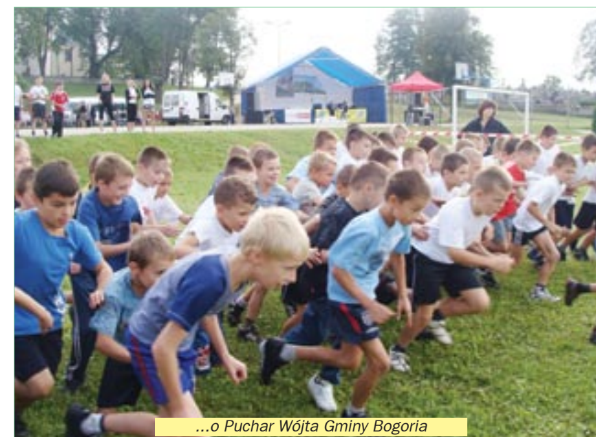
...o Puchar Wójta Gminy Bogoria