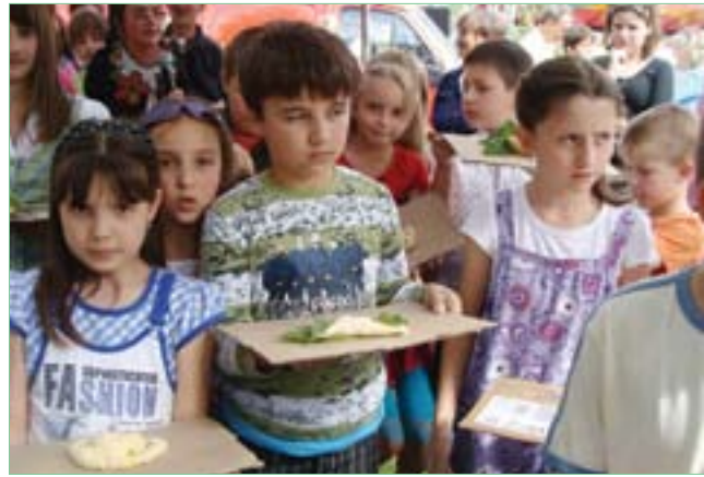
II Gminne Święto Pieroga – Wysoki Średnie 2010