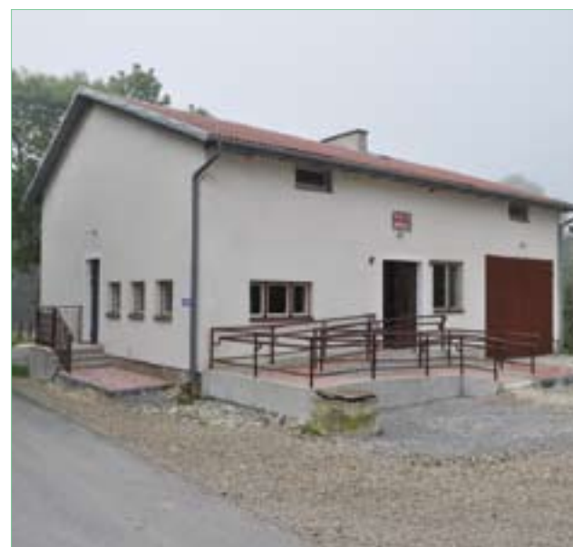
Domaradzice – świetlica i remiza OSP