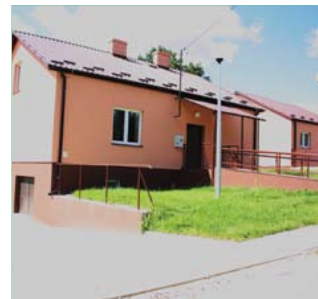
Ceber – świetlica wiejska