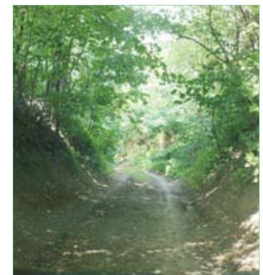
Wąwóz w Kiełczynie