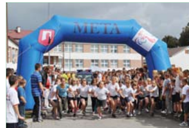
„Świętokrzyski Bieg po zdrowie”