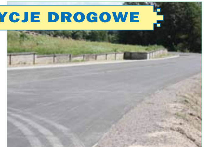
Obwodnica Bogorii w kierunku na Staszów-Klimontów