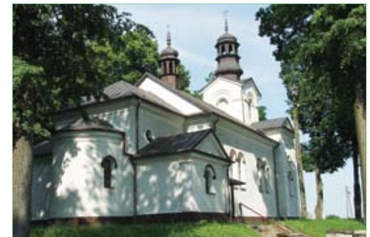
Kościół pw. św. Mikołaja w Kiełczynie