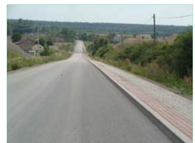
Jurkowiec-Budy – wyremontowana droga i nowe chodniki