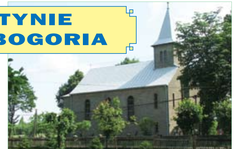
Kościół pw. św. Andrzeja Boboli w Niemirowie