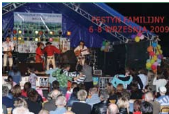
Woj. Święto Ekologii połączone z dożynkami – występ zespołu „Krywań” oraz wystawa produktów ekologicznych