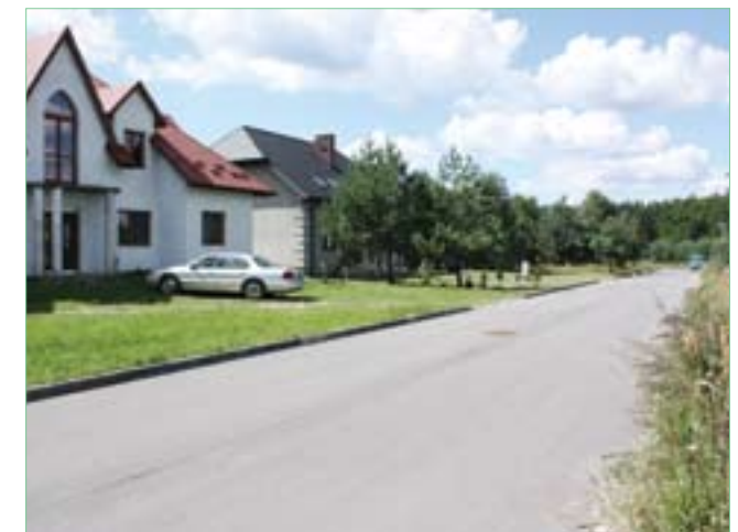
Jurkowiec-Budy – wyremontowana droga i nowe chodniki