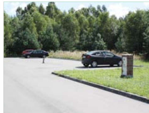
Parkingi oraz ulice na os. Ujazd w Bogorii