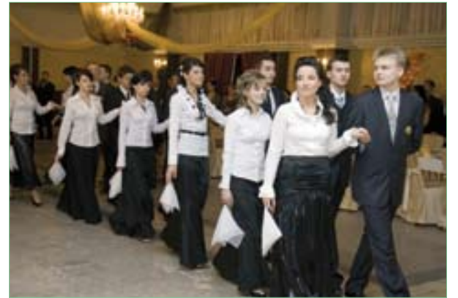
Tradycyjny polonez podczas studniówki w bogoryjskim LO