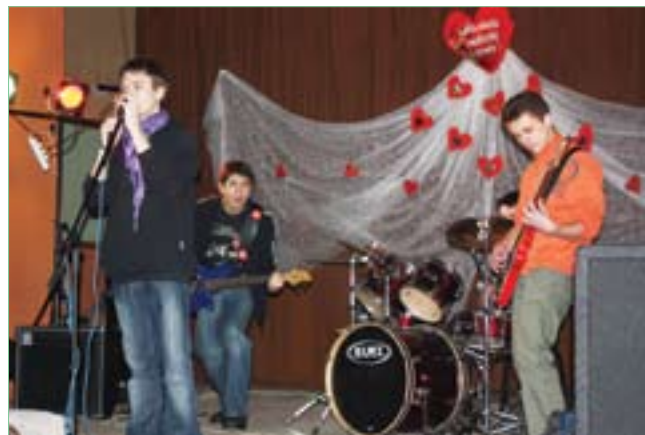
Koncert w ramach Wielkiej Orkiestry Świątecznej Pomocy