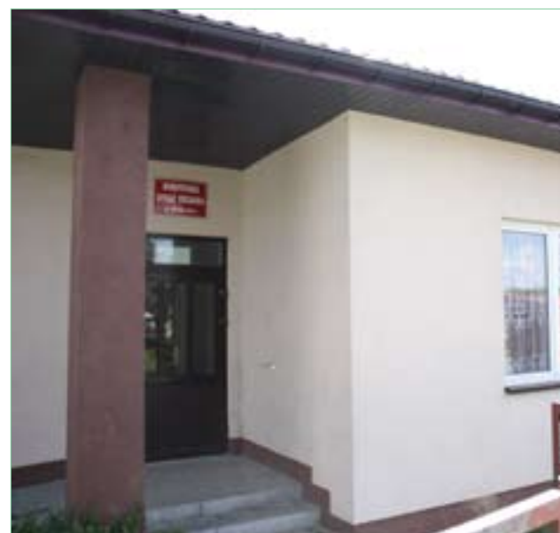
Wierzbka – świetlica i remiza OSP