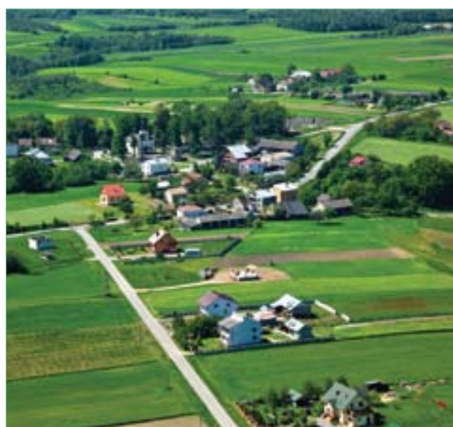
Widok na Kiełczyń