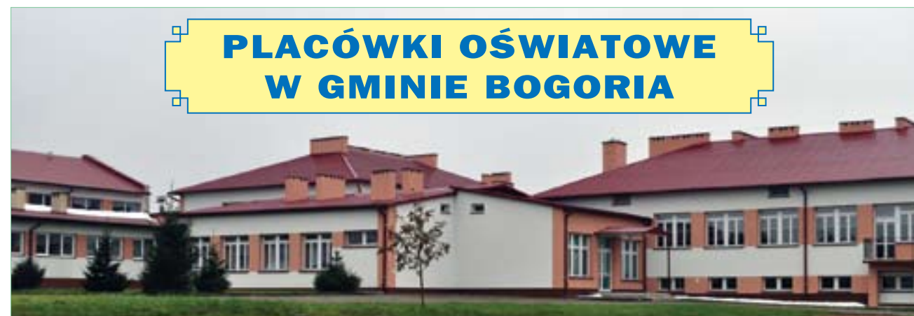
Publiczna Szkoła Podstawowa w Jurkowicach