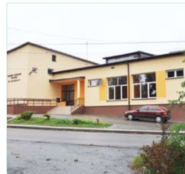
Budynek GOK po remoncie