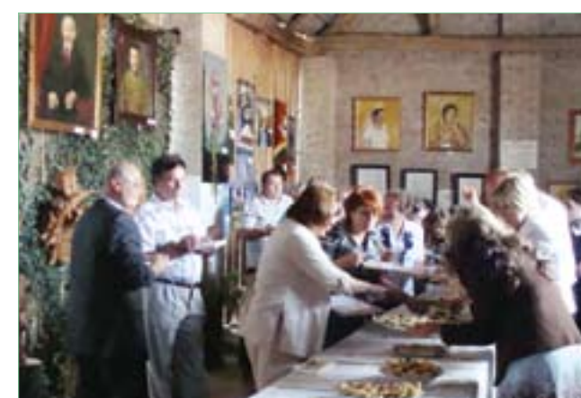
Wysokie Średnie – II Gminne Święto Pieroga 2010