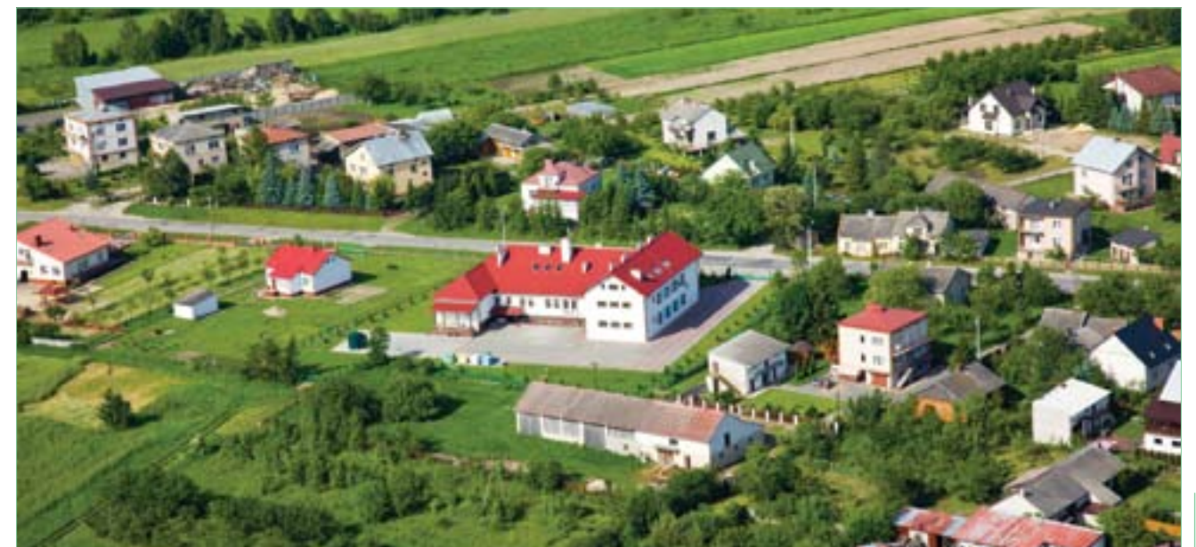
Nowy budynek Urzędu Gminy w Bogorii

• przebudowa oświetlenia drogowego – 44.843,05 zł • urządzenie terenów zielonych i wypoczynkowych w centrum Bogorii – 369.674,31 zł (środki w wysokości 262.562,00 zł pozyskano z Sektorowego Programu Operacyjnego „Odnowa Wsi”) • przekazano dotację Zakładowi Gospodarki Komunalnej w Bogorii na zakup karko-ladawarki w kwocie 239.000,00 zł • opracowano Miejscowy Plan Zagospodarowania Przemysłowego Gminy Bogoria oraz zmiany w Studium Uwarunkowań – koszt 280.000,00 zł • zakupiono ciągnik wraz z przyczepą, beczka asemizacyjną, pługiem, rozsiewaczem do wapna – koszt 200.000,00 zł.