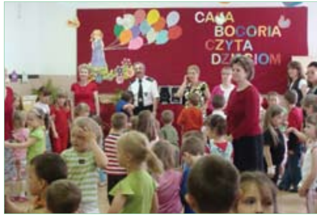
Co roku „Cała Bogoria czyta dzieciom”