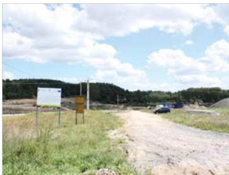
Ruszyła budowa zbiornika wodnego w Bogorii

Zmiany, które planowane są w Gminie, na pewno znacznie poprawią jej walory rekreacyjno-turystyczne, a co za tym idzie, przyczynią się do atrakcyjniejszego spędzania czasu wolnego mieszkańców i przyjeżdżających tu gości. Staną się dodatkowym bodźcem dla rozwoju agroturystyki oraz lokalnej gospodarki.