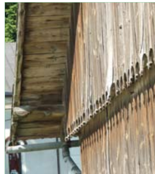
Piękna architektura plebanii w Kiełczynie