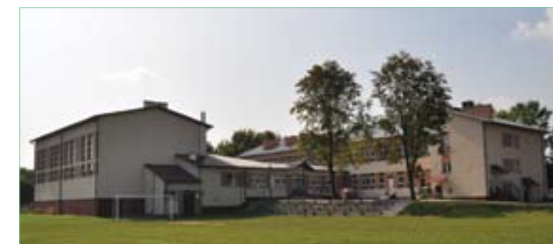
PSP w Szczeglicach