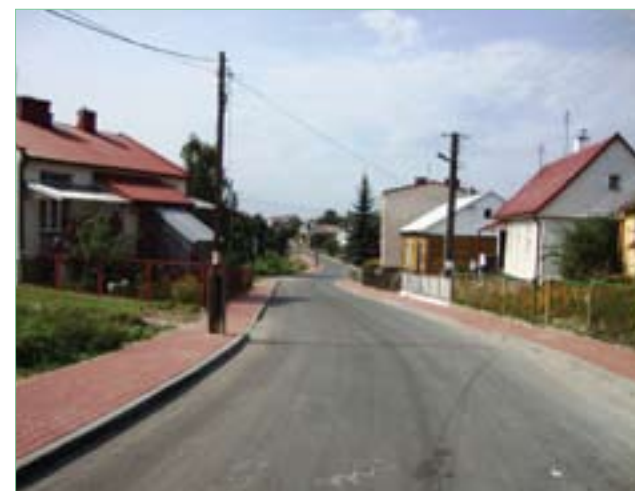
Bogoria – ul. Kolejowa