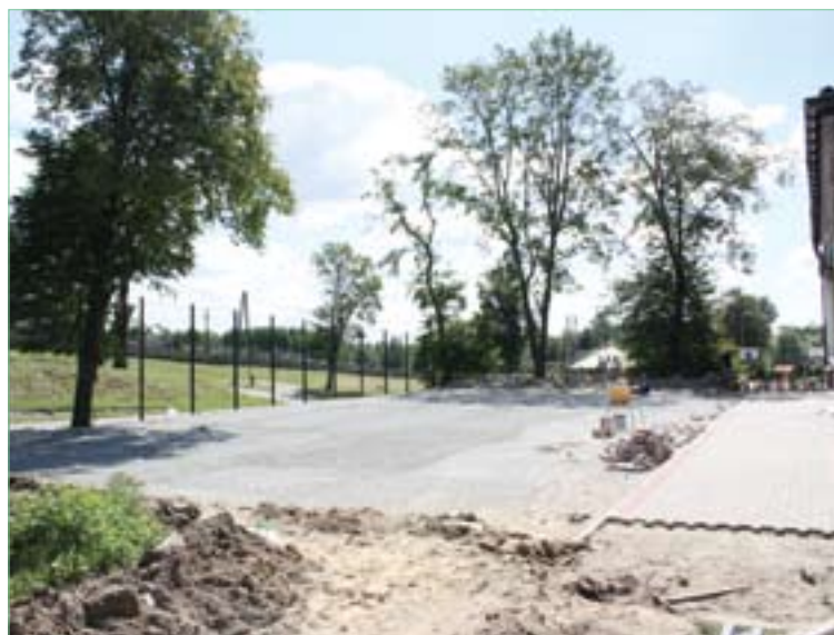
Przebudowa boiska przy Szkole Podstawowej w Bogorii