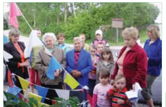
Majówki przy kapliczkach – Grzybów Szczegliki