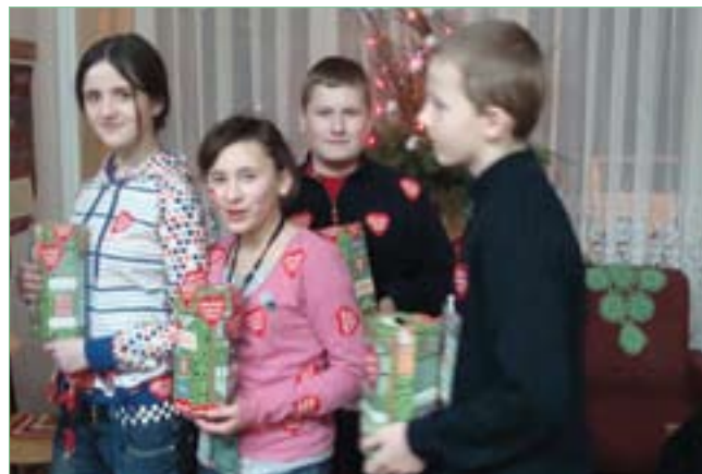
Wolontariusze Wielkiej Orkiestry Świątecznej Pomocy