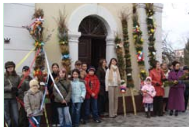
Tradycyjne palmy wielkanocne – Bogoria