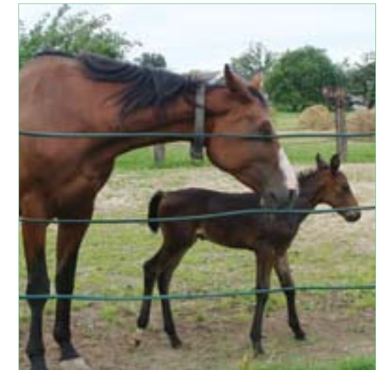
Hodowla koni w Przyborowicach