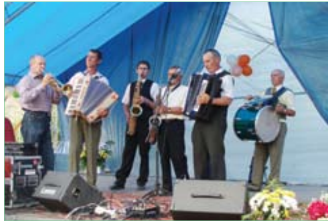
Zespół „Sami Swoi” z Wysók Średnich