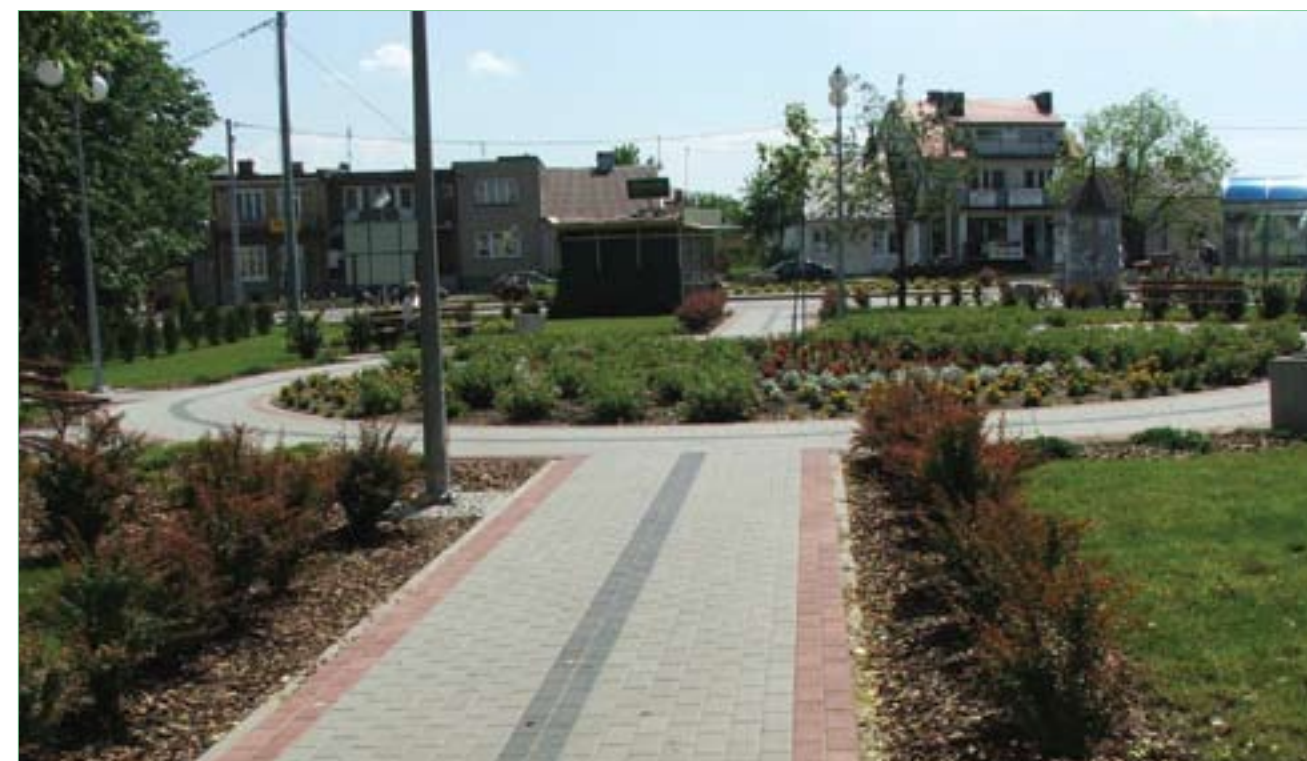
Rynek w Bogorii

Choć Bogoria istniała już od 1616 roku jako miasto i posiadała urząd miejski, to gminą została stosunkowo późno, bo dopiero po II wojnie światowej. Z chwilą utraty praw miejskich w wyniku ukazu carskiego z 1 czerwca 1869 roku administracyjnie wchodziła w skład Gminy Wiśniowa. Dopiero w 1955 roku w Bogorii zaczęła funkcjonować Gromadzka Rada Narodowa. Po okresie zniszczeń wojennych Bogoria długo leczyła rany. Powoli zaczęły się poprawiać warunki życia. Rozbudowano stację kolejową i połączenia kolejowe. Ulepszono drogi. Zaczęto budować nowe domy. Przeprowadzono elektryfikację.