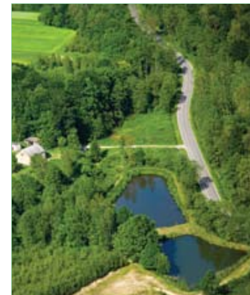
Stawy w Buczyń