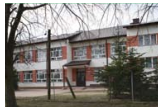
PSP w Niedźwiedziu