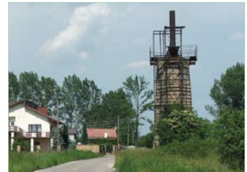
Stary wapiennik przy drodze na os. Ujazd w Bogorii