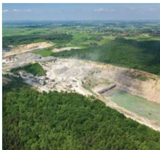
Jurkowie – kamieniołom