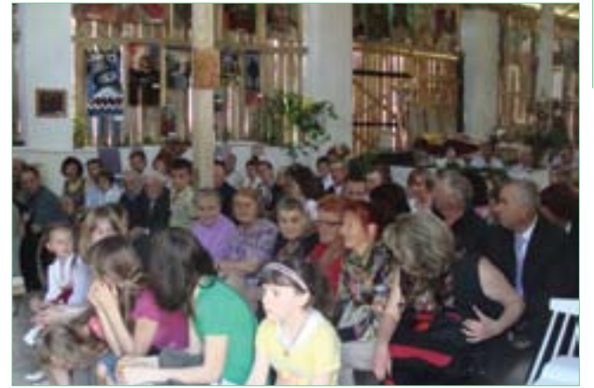
Spotkania w „Stodole” Wł. Sadłochy w Wysokach Małych