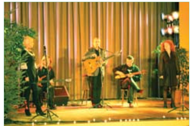
„Czerwony Tulipan” na otwarciu GOK-u po remoncie