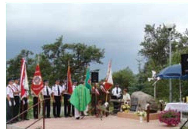
Ceber – coroczne uroczystości w rocznicę Akcji „Burza”