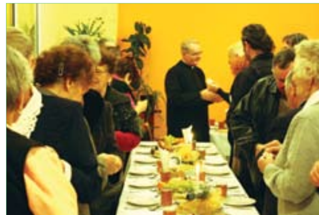
Wigilia 2009 w GOK w Bogorii