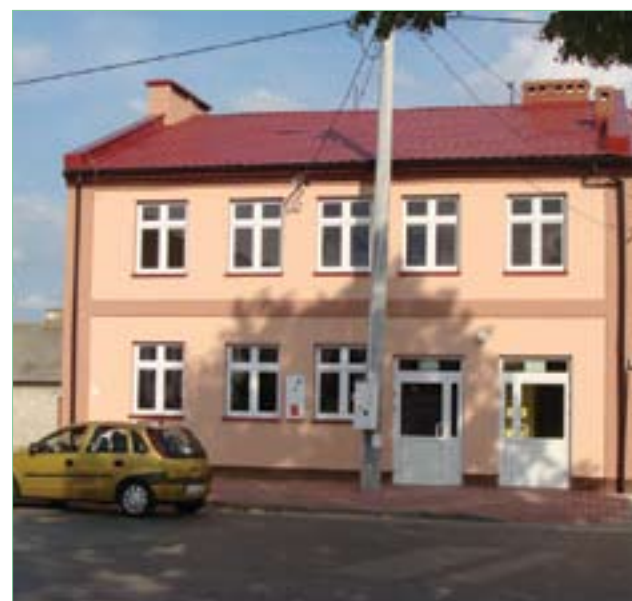
Nowy budynek Jadłodajni