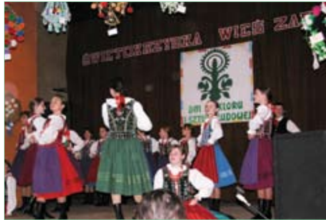
„Dni Folkloru i Sztuki Ludowej” – GOK Bogoria