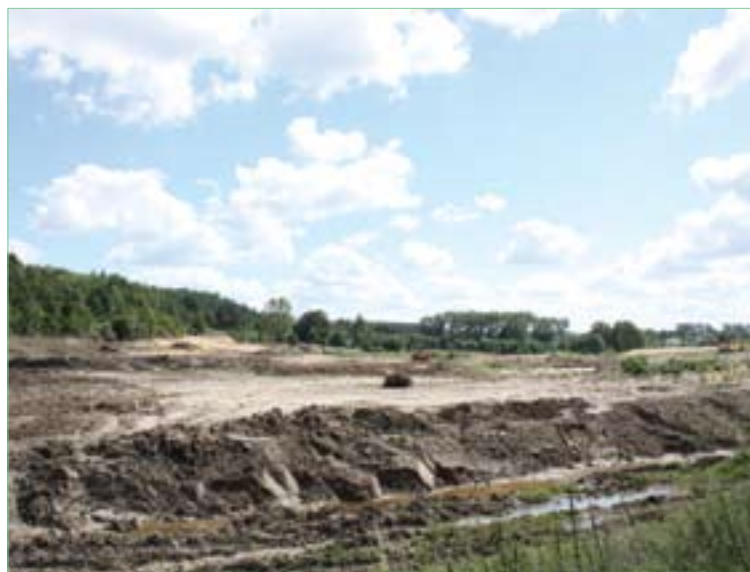
Plac budowy zbiornika retencyjnego