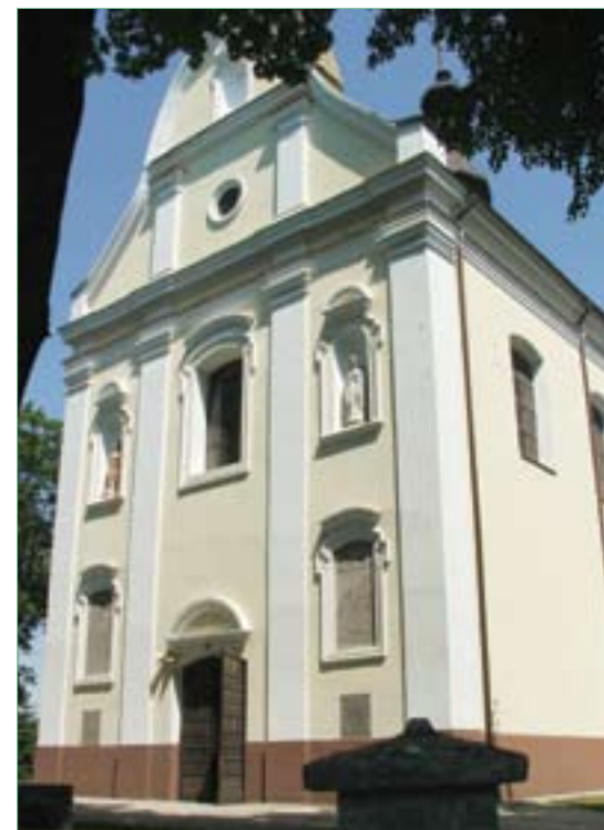
Sanktuarium Matki Bożej Pocieszenia w Bogorii