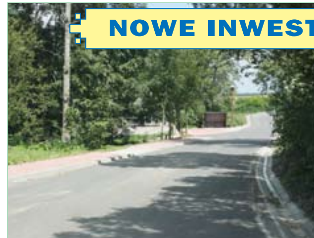
Grzybów – nowa droga z chodnikami