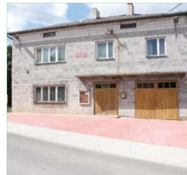
Grzybów Szczeglicki – remiza OSP