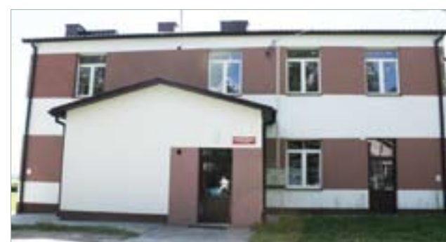
Przedszkole w Kietczynie