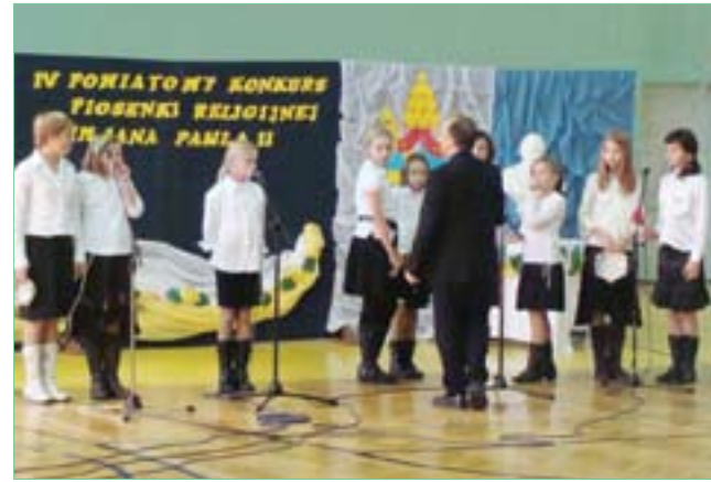
Powiatowy Konkurs Piosenki Religijnej – Bogoria 2009