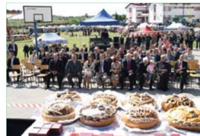
Woj. Święto Ekologii i Dożynki Powiatowo-Gminne 2009