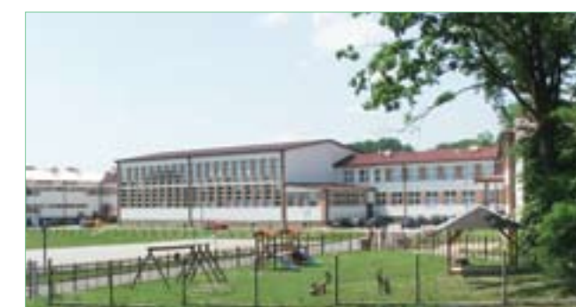
Zespół Szkół – LO, gimnazjum i przedszkole w Bogorii