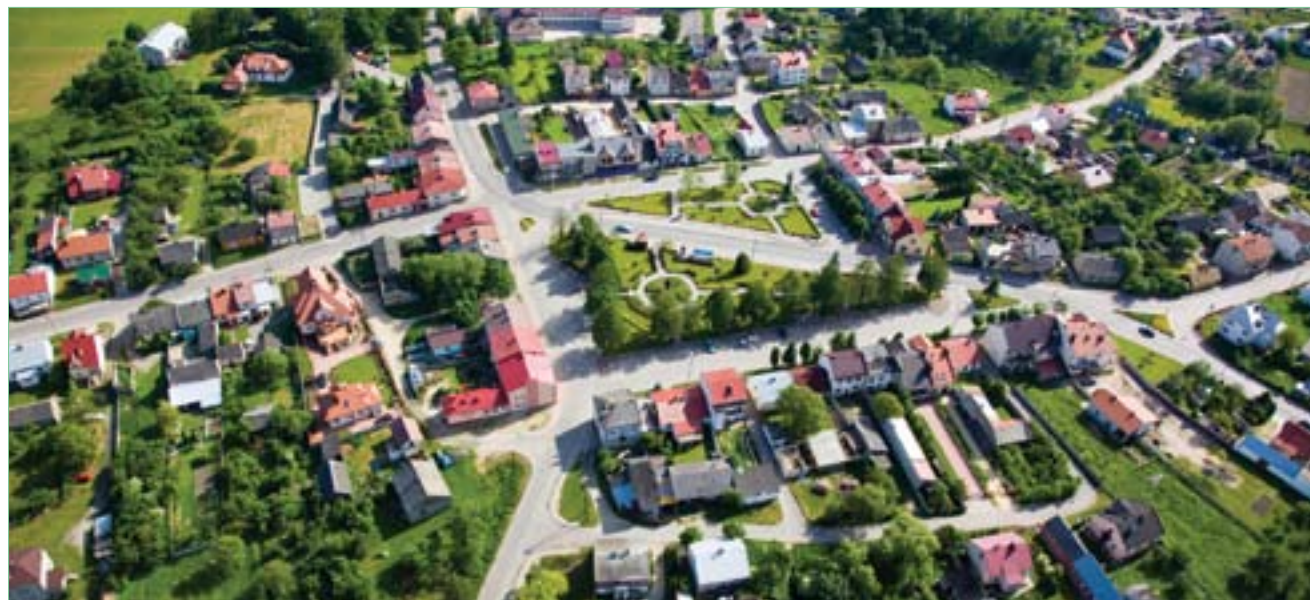
Centrum Bogorii z lotu ptaka