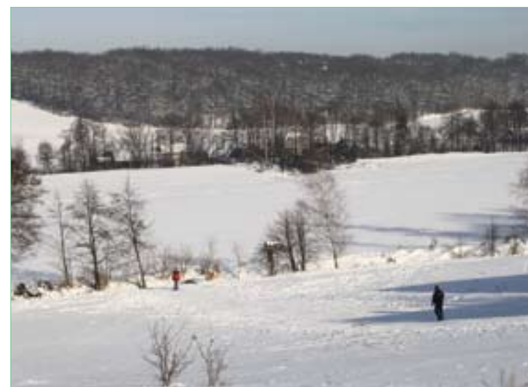
Zimowy pejzaż Buczyny