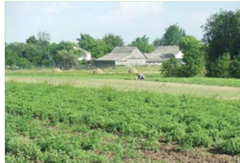
Uprawa ekologiczna ziół, warzyw i owoców