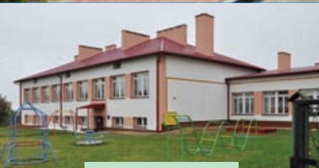
SZKOŁA W JURKOWICACH