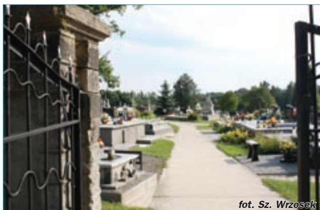
fol. Sz. Wrzosek

z 1915 r. kapitan Kazimierz Herwin Piątek, zmarły w wyniku odniesionych ran – o czym informuje tablica pamiątkowa umieszczona na zewnątrz.