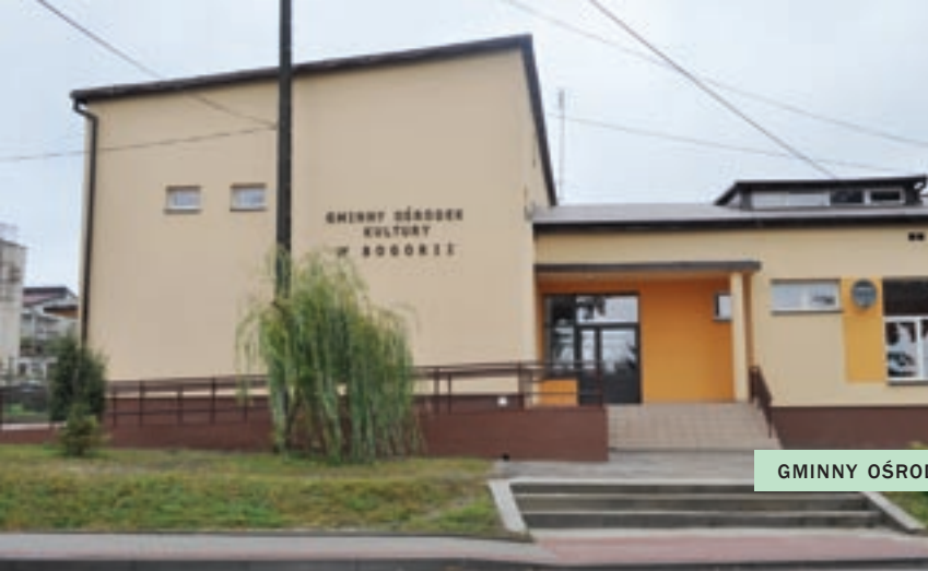
GMINNY OŚRODEK KULTURY