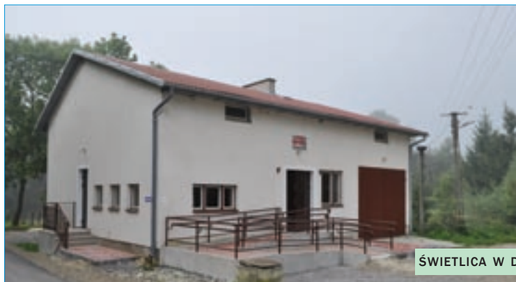
ŚWIETLICA W DOMARADZICACH